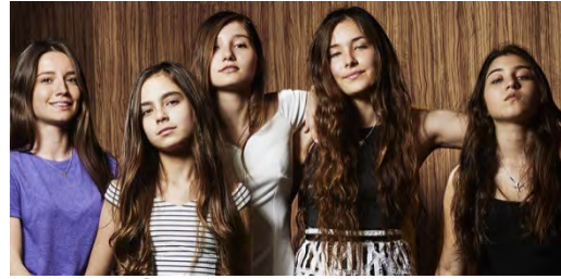
Mustang, Deniz Gamze Ergüven, 2005