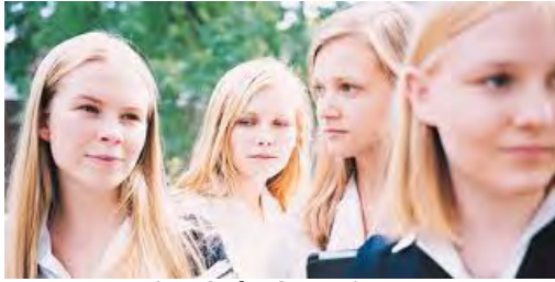
Virgin suicides, Sofia Coppola, 1999