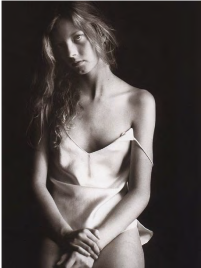
The age of Innocence, David Hamilton