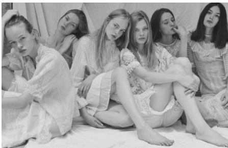
The Age of Innocence, inspiré David Hamilton