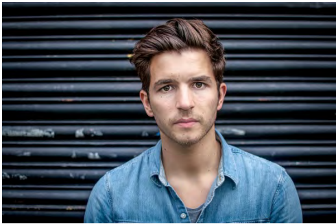
Matteo Simoni, acteur flamand